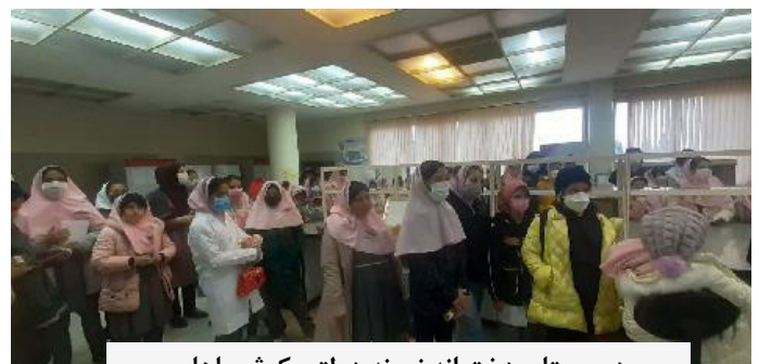
دبیرستان دخترانه نمونه دولتی کوثر ماهان