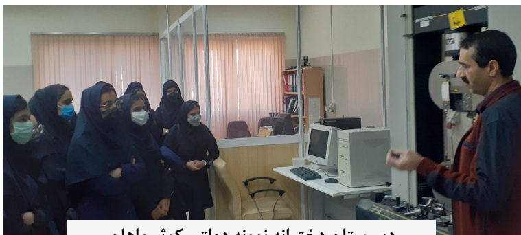
دبیرستان دخترانه نمونه دولتی کوثر ماهان