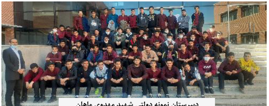
دبیرستان نمونه دولتی شهید مهدوی ماهان