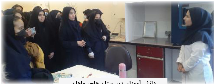
دانش آموزان دبیرستان هاجر ماهان

معاون دانشجویی و فرهنگی دانشگاه تحصیلات تکمیلی صنعتی و فناوری پیشرفته، بازدیدهای دانش آموزی از دانشگاه را زمینه ساز تقویت روحیه خودباوری و اعتماد به نفس دانش آموزان عنوان و بر آشنایی نسل نوجوان و جوان.