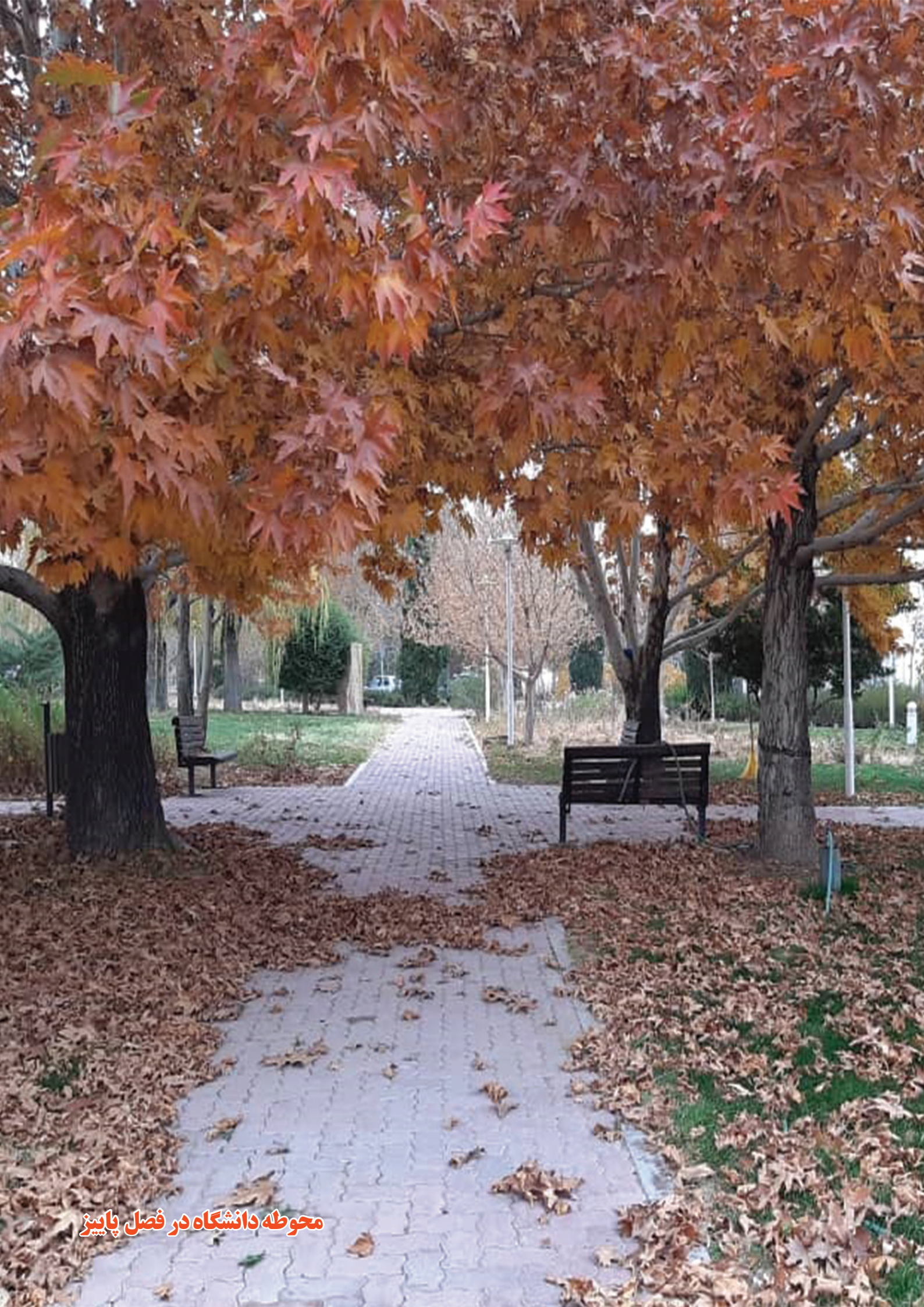
محوطه دانشگاه در فصل پاییز