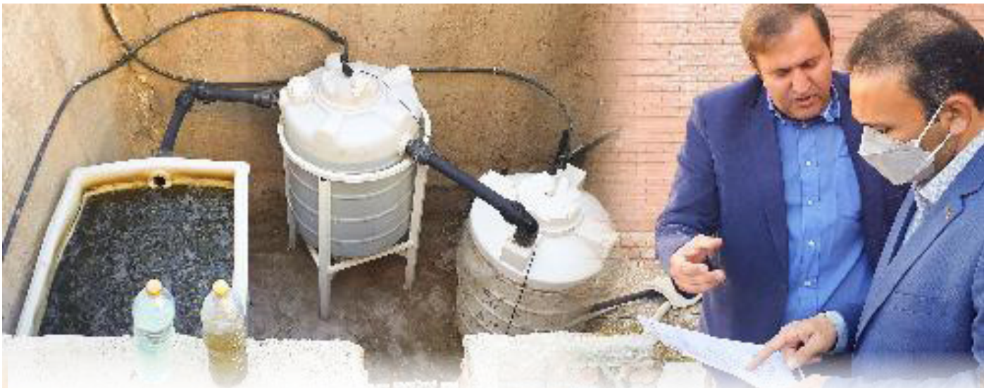
در قالب دو طرح پژوهشی داخلی؛